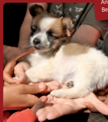
Hand in Hand – viele Nationalitäten arbeiten perfekt miteinander