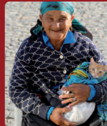
Tiertransportbox à la Sal