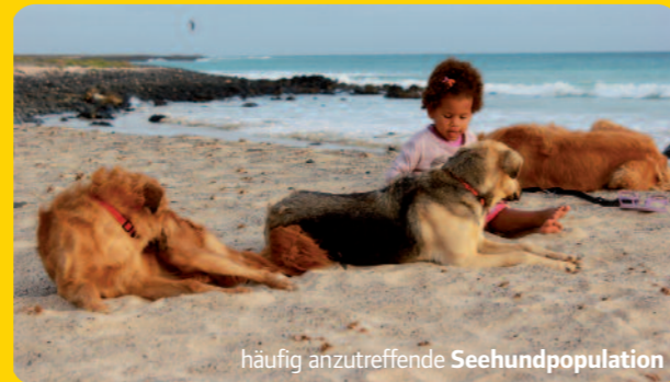
häufig anzutreffende Seehundpopulation

14 TAGE EINSATZ = 595 OPERATIONEN >> DAVON 530 KASTRATIONEN