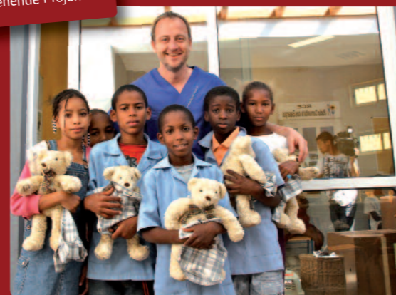
Hier ist der Bär los! Neben Funk- & Fernsehinterviews konnten in den zwei Wochen über 100 Bären erfolgreich vermittelt werden