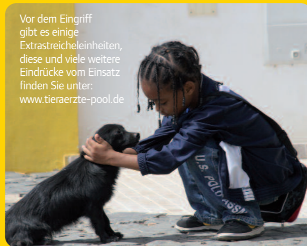
Vor dem Eingriff gibt es einige Extrastreicheleinheiten, diese und viele weitere Eindrücke vom Einsatz finden Sie unter: www.tieraerzte-pool.de

...ist eine Insel im Atlantik zwischen Senegal und Brasilien. Sie gehört zu der Gruppe der Kapverdischen Inseln (grüne Inseln). Insgesamt bestehen die Kapverden aus 10 besiedelten Inseln. Sal bietet für Wassersportler ideale Bedingungen. Größere Hotels haben sich inzwischen an den traumhaften Stränden angesiedelt. Das Wetter ist ganzjährig warm und Regen fällt äußerst selten.