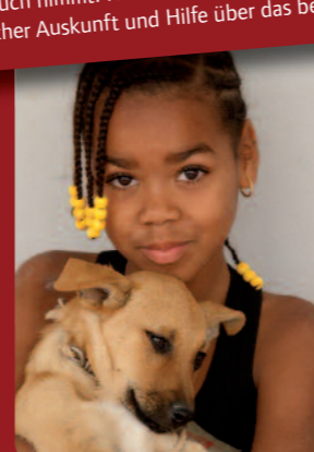
Braunäugig und bildhübsch sind diese beiden Kinder